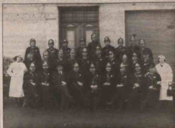
▲ Członkowie Ochotniczej Straży Pożarnej z Szumbarku w 1936 roku podczas obchodów jubileuszu 35-lecia założenia straży.

najbardziej zresztą praktyczne, było, że naczelnik był zawsze osobą zamożną, sprawował więc równocześnie funkcję mecenasa straży pożarnej. Stąd też pierwsza remiza, wtedy zwana „strażniczą”, mieściła się we dworze F. Wintka, a po jego odsąpieniu u gosподzkiego Roznera. W 1902 roku obok miejscowej szkoły wybudowano remizę drewnianą, która służyła szumbarskim strażakom przez kolejnych niespełna dwadzieścia pięć lat, do chwili, nim zwałił ją huragan w listopadzie 1926 roku. Nowa remiza, co prawda z drewnianą więźą, niemniej już murowana, stanęła w rok później obok nowej szkoły. W tym samym roku mieszkańcy Szumbarku deklarując narodowość czeską, założyli swoją straż ochotniczą pn.