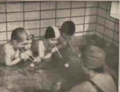
▲ My dzieci z Oldrzychowic, wspólnie z kolegami w Nieborach przygotowaliśmy widowisko muzyczne „Na pasionku”. ♦ Od pół roku jeździmy do Keny klubu w Trzyciu i niekiedy z nas już całkiem dobrze pływają.

Do Oldrzychowic wrócićmy jeszcze w następną sobotę, a tymczasem sobocymy, co dzialo się ostwiecie w Kar-winie.