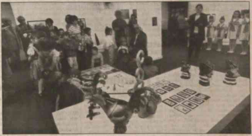
▲ Zgrombie z kilkadziesiątą już tradycją, również w tym roku Miejski Dom Kultury w Karwinie przygotował wystawę specjalnie przeznaczoną dla najmłodszych odbiorców sztuki plastycznej. Ekspozycja pt. „Plastyka regionu dla dzieci” obejmuje najróżniejsze techniki od grafiki przez rysunek, ceramikę, rzeźbę, kuletki aż po najróżniejsze ukłádanki i wycinanki, a powstała z myślą o dzieciach oraz o zbliżającym się ich święcie. Czwartkowy wernisaż (parę zdjęć) spotkał się z niekłamnym zainteresowaniem bodajże siedemdziesiątki gości, w przeważającej mierze przedszkolaków. Dzieci mogły bowiem zabawiać się w wycinanie oraz układanie, a także obejrzeć bajki. Cieszyć oko małych, nieco większych i zupełnie dużych zwiedzających wystawa będzie do 2 lipca br., od poniedziałku do piątku w godzinach od 9.00 do 17.00. (sch)