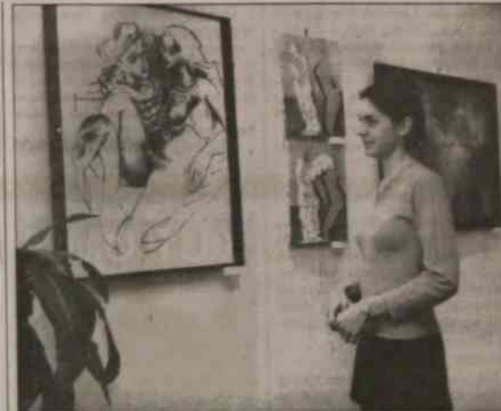
▲ Oostawska wystawa „Erotyzm w słowackiej sztuce plastycznej” pozwoli poznać twórczość wielu przednich słowackich artystów.