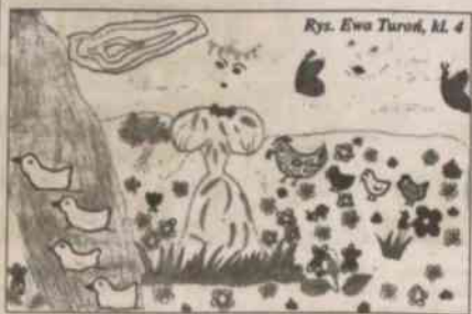
Piękne podtrowienia z podmuchem wiosennego wiatru przesyłają uczniowie PSP w Nydku