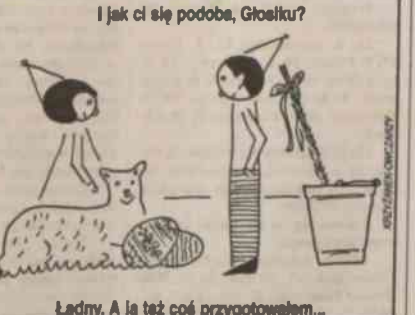
No tak. Mam pomysł: Zrobię sobie wielkanocny kącik!