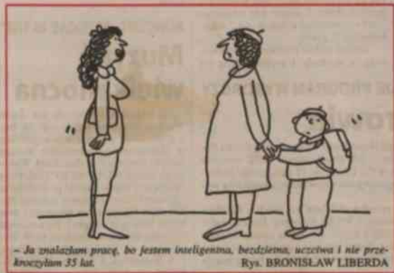
~ Ja znalazłam pracę, bo jestem inteligentna, bezdzietna, uczciwa i nie przekroczyłam 35 lat. Rys. BRONISŁAW LIBERDA

NIEDZIELA - Pochmurno z większymi przejaśnieniami, lokalnie możliwe opady deszczu lub deszczu ze śniegiem. Temperatura w nocy bez zmian, w dzień - od plus 4 do plus 8 st. C.