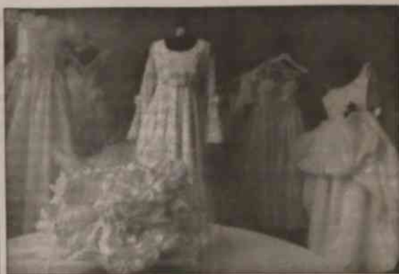
▲ Coraz większą popularnością cieszą się wypożyczalnie sukien ślubnych.

jeszcze doliczyć zaproszenia, muzyków i kogoś, kto uwieczni nam ten moment na zdjęciach oraz zarejestruje na kasie wideo. „Z wesele” - żali się właścicielka salonu fotograficznego „Jana” w Hawierzowie - „wielkiego zarobku nie mamy. Ludzie zamawiają tylko sześć pozowanych zdjęć. Reagują robią sami, bo dzisiaj każdy wujek ma automatyczny aparat i przyka zdjęcia bez opamiętania”.