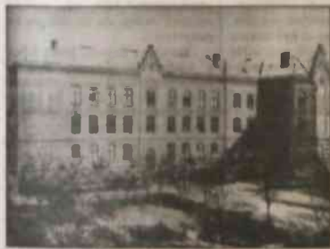
▲ Klášterna dziewczęca szkoły sióstr notredamski w Nowym Boguminie na zdjęciu z 1900 r.

V - zapewnienia, aby osoby posługujące się językami regionalnymi lub mniejszościowymi mogły składać dokumenty w tych językach. (c.d.a.)