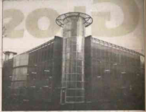
W pół roku po otwarciu garaży pod placem Prokolla w centrum Ostrawy ruszył nowy obiekt spółki „Garaz”. Wraz z 1 lutego, po pięciu miesiącach intensywnych prac budowlanych, otworzy swoje drzwi nowy, piętno parking na Czarną Łęcę.

WAWRZYNEC FOJCIK prezes Rady Polaków, organu wykonawczego Kongresu Polaków w RC