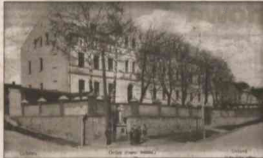
▲ Orlawki klasztor na starej poczówce (ok. 1918 r.).

nie konkretnie chodziło o Siostry Chorych Ubogich, nazywane też Juciszczkami Boskiego Serca Jezusowego w Śląskiej Ostrawie, gdzie internowano cztery zakonnice, trzy siostry należące do kongregacji Służebnic Panny Marii w Karwinie II i cztery szkolne siostry notredamski w Nowym Boguminie. Razem więc w ramach akcji „VZK” zlikwidowano na Śląsku Cieszyńskim trzy klasztory żeńskie i internowano 11 sióstr zakonnych. Tyle przynajmniej da się