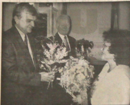
▲ Z czwartkowego spotkania zaolziańskich pedagogów w Konsulacie Generalnym RP w Ostrawie.

Nie sygnowane materiały publicystyczne i informacyjne pochodzą z satelitarnego serwisu informacyjnego Polskiej Agencji Prasowej.