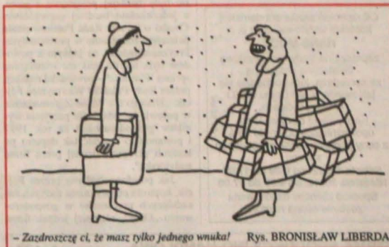
- Zastroszczę ci, że masz tylko jednego wnuka! Rys. BRONISŁAW LIBERDA

PONIEDZIAŁEK - Przelotne opady śniegu. Temperatura w dzień od -2 do 2 st., nocą od -2 do -5 st. C.