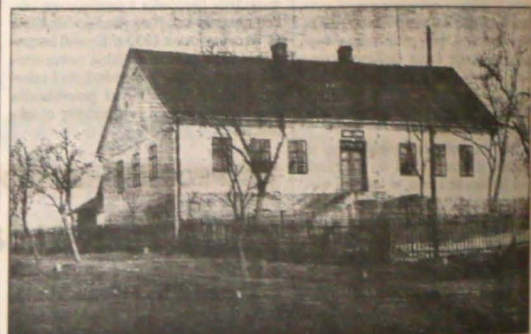
▲ Budynek szkoły, którą w 1857 roku wybudowali ewangelicy z Grodziszczu, Koniakowa i Wołowca.