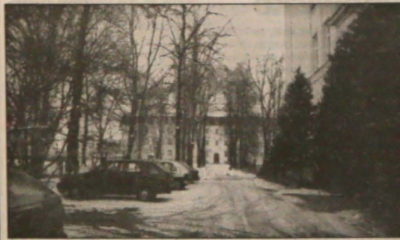
▲ Ulica dr. Olszaka w Karwinie-Frystacie.

PIĄTEK - Zachmurzenie umiarkowane, niewielkie opady śniegu. Temperatura bez zmian.