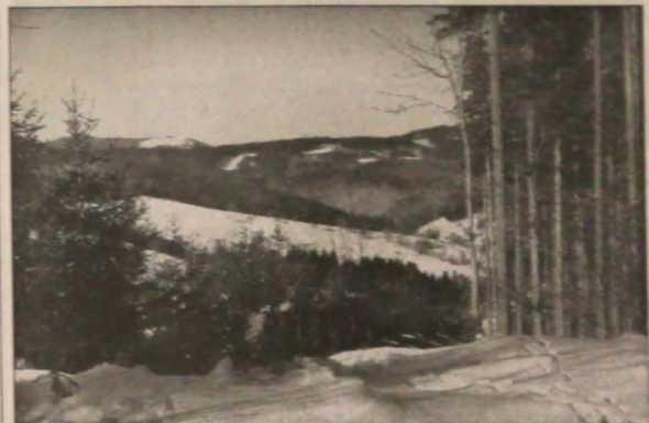
▲ Pięknie prezentują się zamieźone Beskidy. Na zdjęciu: widok z Wielkiego Polowa do doliny Przelaczy oraz na pasmo Sławicza i Trawnego.

Według informacji naczelników wydziałów dróg Usług Technicznych, soli, solanki, żużlu czy piasku nie powinno zabraknąć do końca zimy. (wak)