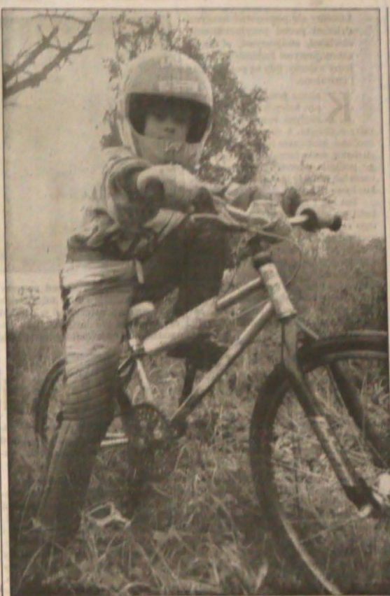
▲ Zamiast ślepczyć przed telewizorem i zajądąć się chipsami, lepiej spędzić wolne chwile w ruchu na łonie natury.

Nasz system ochrony zdrowia nastawiony jest w głównej mierze na medycynę naprawczą, nie zaś, jak w wielu krajach zachodnich, na medycynę prewencyjną. I to jest duża wada. Zdaniem fachowców dobra prewencja pozwoliłaby m.in. na zmniejszenie śmiertelności z powodu chorób serca o ok. 34 proc. A trudno ukryć, że cierpimy dziś na epi-