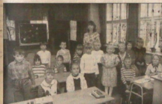
▲ Klasa pierwsza ► Chór szkolny

szkolny, urządzone są tu przedstawienia szkolne. Uczniowie bystrzyckiej szkoły mają na swoim koncie wiele osiągnięć sportowych - w Zjeździe Gwiazdzistym zajęli pierwsze miejsce 13 razy, w Pucharze Radia Czeskiego w Olomuńcu w czerwcu br. uplasowali się na II miejscu.