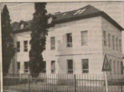
▲ Budynki szkolne w Bystrzycy - nowszy 75-letni (z lewej) oraz 100-letni.