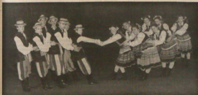
▲ Zespół „Łączka” w strojach lubelskich.