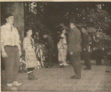
▶ Z obchodów 66. rocznicy tragedii Żwirki i Wigury na kościeleckim wzgórzu.