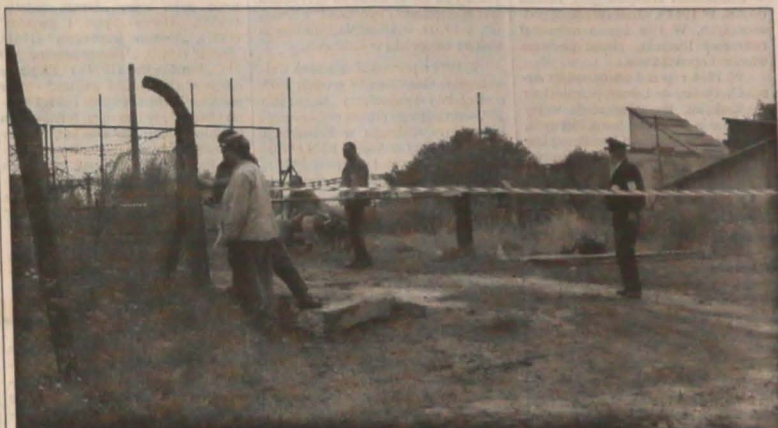
▲ Teren katastrofy ściśle zamknięto. Dostępu do ogromnego leja, w którym zniknęła wieża szybu wentylacyjnego „Dąbrowa 4”, strzegli przed ciekawskimi policjanci i ochotnicy. Nawet fotografom prasowym pozwolono zbliżyć się do strefy bezpieczeństwa na odległość co najwyżej 150 metrów.

Na miejscu katastrofy znajduje się ekipa specjalistów, dochodząc przyczyn wypadku.