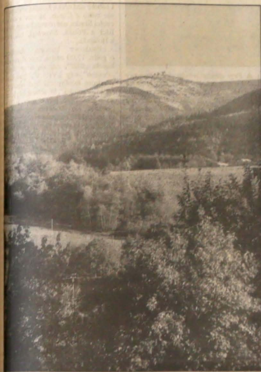
▲ Beskidki pejzaz.