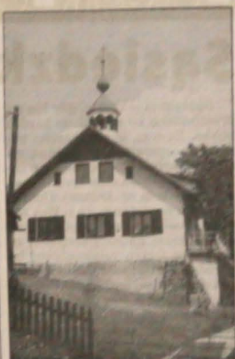
▲ Stara szkoła, dziś budynek prywatny