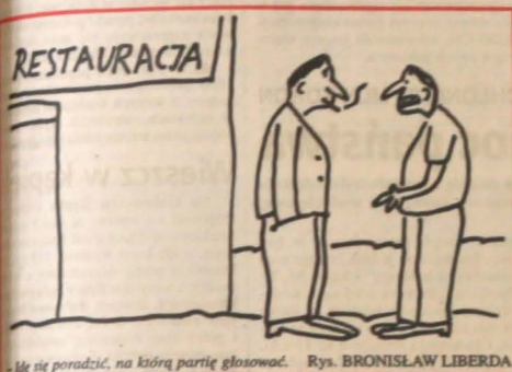
- Mę się poradzić, na którą partię głosować. Rys. BRONISŁAW LIBERDA