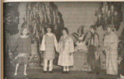
▲ Przedstawieniem sztuki scenicznej Władysława Młynka „Cudowny owoc” dzieci zainaugurowały obchody jubileuszowe 170-lecia szkoły.

mogli obejrzeć wystawę ilustrującą historię i dorobek szkoły koszarzyńskiej.