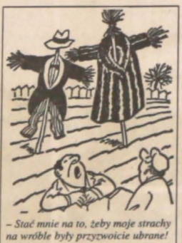
Stać mnie na to, żeby moje strachy na wróble były przyzwicie ubrane!