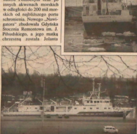
▲ M/s „Nawigator XXI”.