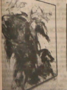
▲ Jut tylko do niedzieli 8 bm. oglądać można w karwińskiej Galerii Zamkowej Centrum Plastycznego „Chagall” wystawę ekspresyjnych obrazów Antoniego Króty z Ostrawy.

HAWIERZÓW-MIASTO - Zespół Kobiet przy MK PZKO zaprasza na spotkanie dziś, 5. 3. o godz. 15.00 do świetlicy przy ul. Matuška 2. TRZYNIEC - Luterański Kościół Ewangelicki A.W. zaprasza na koncert