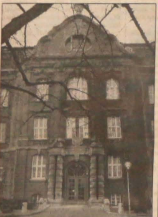
▲ Wyższa Szkoła Morska w Szczecinie.