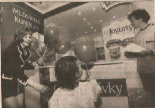
▲ Od poniedziałku brneński areal wystawowy gości pięć gastronomicznych targów wystawowych - „Salima”, „Ibuco”, „Fruvex”, „Inteco” i „Vnux”. Na zdjęciu: do konkursu o „Złoty Salming” zgłosiła się m.in. mleczerka z Kuliną z deserami budyniowymi „Samba” i „Rumba”.

Na projekty kulturalno-oświatowe PZKO (działalność taneczna i folklorystyczna, śpiewaczo-muzyczna, teatralną i żywego słowa oraz plastyczną)