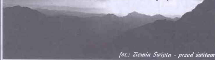
foto.: Ziemia Święta - przed świtem

W czasie 9 dni odwiedzimy główne miejsca życia i działalności Pana Jezusa: Jerozolimę, Betlejem, Ein Karem, Betanię, Qumran, Morze Martwe, Jerycho, Nazareth, Kafarnaum, Górę Błogosławieństw, Jezioro Genezareth, Kanę Galilejską, Tabor, Hajfę, Cezareę Nadmorską.