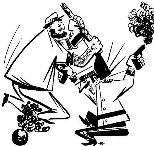
BIJE CUBA DO JACUBA...