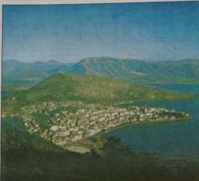
Wybrzeża Pissoderi niedaleko Floriny

To zaskakująco duża wieś, właściwie jedyne „miasteczko” w tym regionie, zabudowana domkami krytymi dachówką. Z ich okien można zobaczyć widoczne z oddali Megali Prespa. Warto tu zajrzeć choćby dla dwóch maleńkich bizanty-