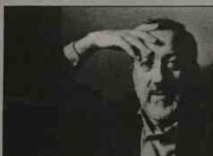
kostiumologów największych scen włoskich. W 1977 przygotowywał scenografię do

Pier Luigi Pizzi – po swym debiucie w Piccolo Teatro prędko zyskał sławę jednego z najbardziej liczących się scenografów i