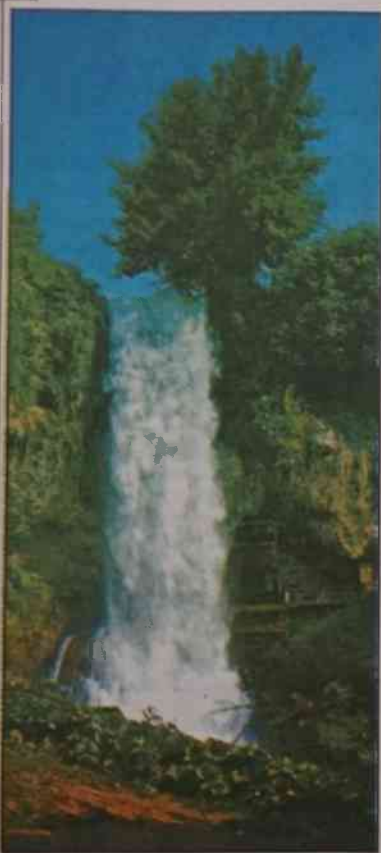
Wodospad w okolicy Edessy

Maj jest chyba najlepszym miesiącem tu w Grecji. Nie jest jeszcze zbyt gorąco i mało jest osób, które korzystają w kąpiel w morzu. Dlatego właśnie proponuję wszystkim wycieczkę nad jeziora w północnej części tego kraju. Okolica jest rzadko odwiedzana przez turystów, może dlatego jest tam jeszcze ładnie, czysto a wszystko wygląda zachęcająco.