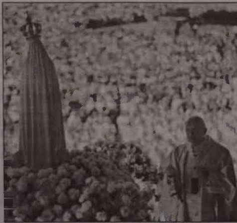
W koronie Matki Boskiej Fatimskiej znajduje się kula wydobyta z ciała papieża

Jednym z watykańskich komentatorów zamachu