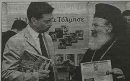
Abp. Chrystodulos z ministrem P. Efthimiu

Abp. Chrystodulos oświadczył w ostatnich dniach, że spotka się z premierem Simitisem, jeśli ten wyrazi pragnienie takiego spotkania. Dopóki jednak to się nie stanie, Święty Synod Kościoła Prawosławnego Grecji będzie trwał przy swoich pozycjach, pomimo, że zgadza się z opinią iż rząd i Kościół powinny ze sobą współpracować w zakresie walki z problemami społecznymi.