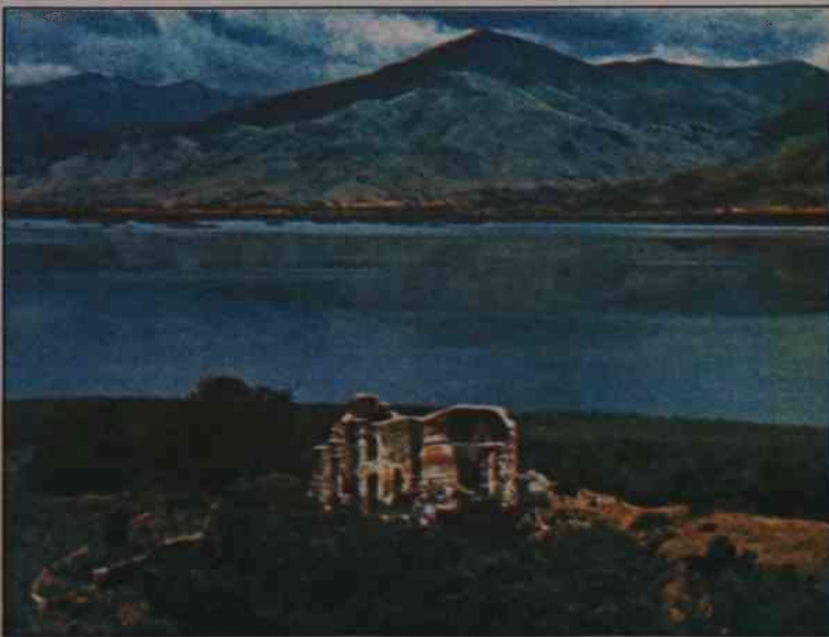
Florina z perspektywy jeziora

Szczyt o wysokości 2524 m. wyznacza granicę Grecji i postawiono na nim kapliczkę AGIOS PANDELEJMONAS, z domami o czerwonych dachach, ruinami wiatraka i niewielką plażą. Około 1,5 kilometra na zachód od Amindeo można zobaczyć z drogi w prawo, nad mniejsze jezioro Petron i wzgórze z ruinami hellenistycznej osady PATRES, na zachodnim brzegu, odkopanej w wczesnych latach 90-tych i interesująco przedstawionej na wystawie w muzeum we Florinie.