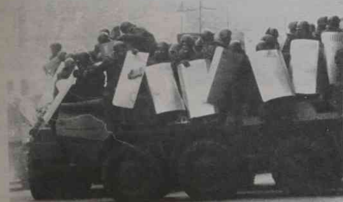
Baku ignoruje sowieckie czolgi.

W moskiewskich hotelach, schroniskach i koszarach gnieździ się 20 tysięcy uchodźców z terenów objętych walkami. Przez dwa lata otwartego konfliktu azerbejdżańsko-ormiańskiego z Zakaukazia uciekło pół miliona ludzi. (mc)