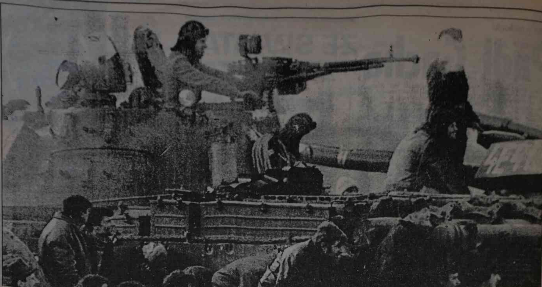
Wojsko przyłącza się do powstańców