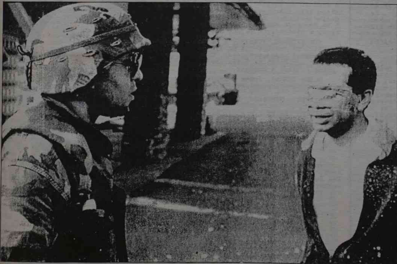
Tak było w Panamie