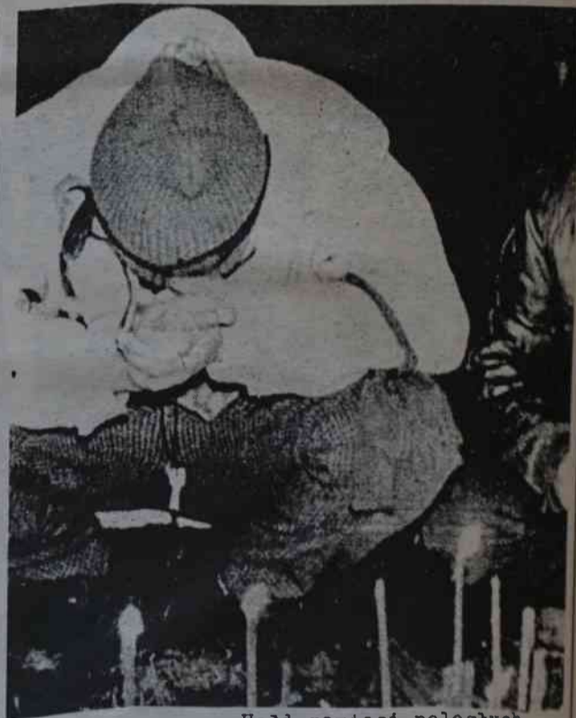
Hołd pamięci poległych

K.P. Chin uznała nowo-powstały rząd rumuński. Jest to wyrazem odcięcia się od Ceausescu - do niedawna dobrego i lojalnego przyjaciela.