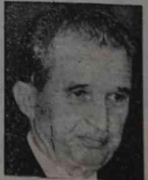
Nicolae i Elena Ceausescu