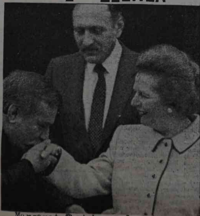
Margaret Thatcher i Lech Wałęsa. O spotkaniu - na str. 5