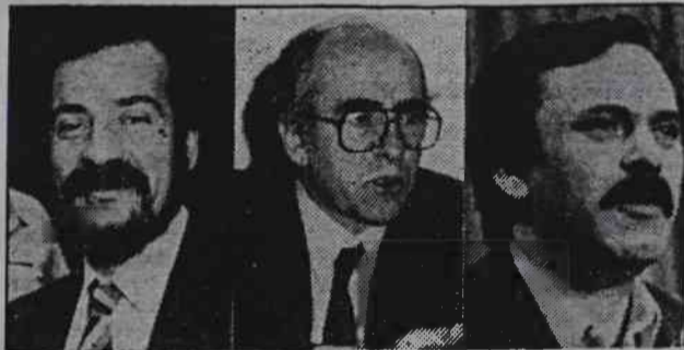
"Wielka Trojca" narodowej ekonomii G.Ghjenimatas (PASOK), G.Souflias (N.D.), G.Dragasakis (Koalicja Sił Lewicy)

rozporządzenia dotyczące podwyżek cen o X.Zolotas wyjeżdża do Brukseli na europejski szczyt krajów członkowskich EWG.