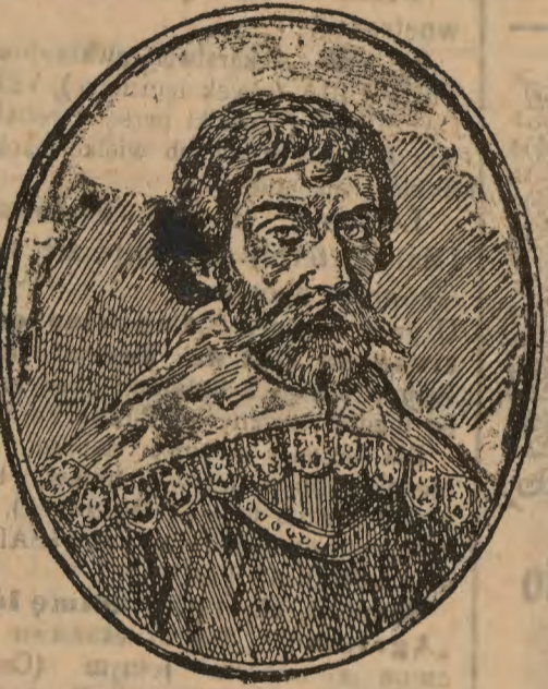
Jan Krzysztof Arciszewski

Co nas intryguje, począwszy od pierwszej kartki, to pytanie, co autor powie o Arciszewskim, w jakim świetle go postawi, jak się do postaci tej odniesie. Jedną trzecią część książki przebrnąć trzeba, zanim natkniemy się na ustęp o nim. Malutko tego, półtorej strony. W dalszym ciągu spotykamy już tylko