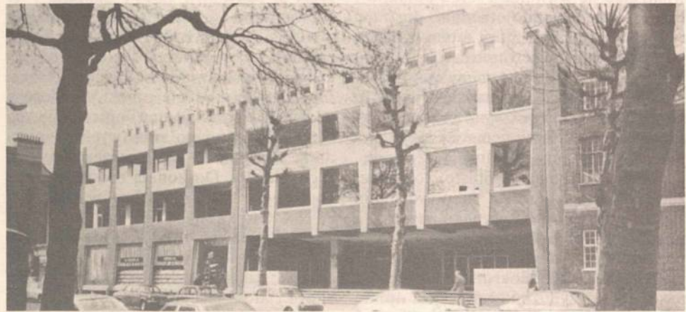
POSK - siedziba PUNO

Działalność Uniwersytetu została przerwana w maju 1940 roku z chwilą zajęcia Paryża przez Niemców. Wznowiono ją, w zmienionej formie i innych