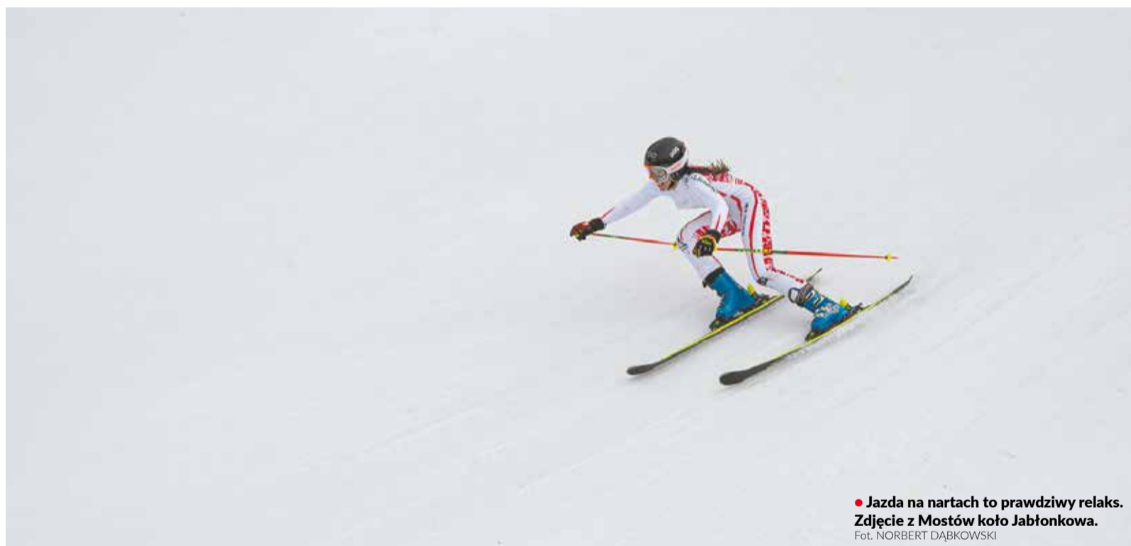
• Jazda na nartach to prawdziwy relaks. Zdjęcie z Mostów koło Jabłonkowa.

– Jesteśmy zmuszeni podejmować takie środki bezpieczeństwa, jakie w tej chwili nakazują nam władze, choć sytuacja ciągle się zmienia – przyznaje Petra Neumannowa. Zaznacza, że zgodnie z obowiązującymi przepisami wymagana będzie dezynfekcja rąk, a przy zakupie biletu potwierdzenie