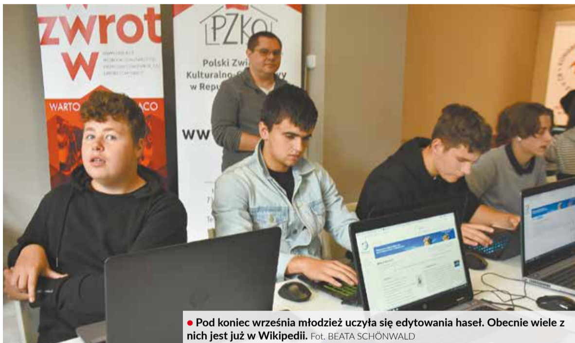
• Pod koniec września młodzież uczyła się edytowania haseł. Obecnie wiele z nich jest już w Wikipedii.

Nagrody za najlepsze nowo utworzone hasło i najlepszy wkład edycyjny w polskojęzycznej Wikipedii jury przyznało użytkownic-