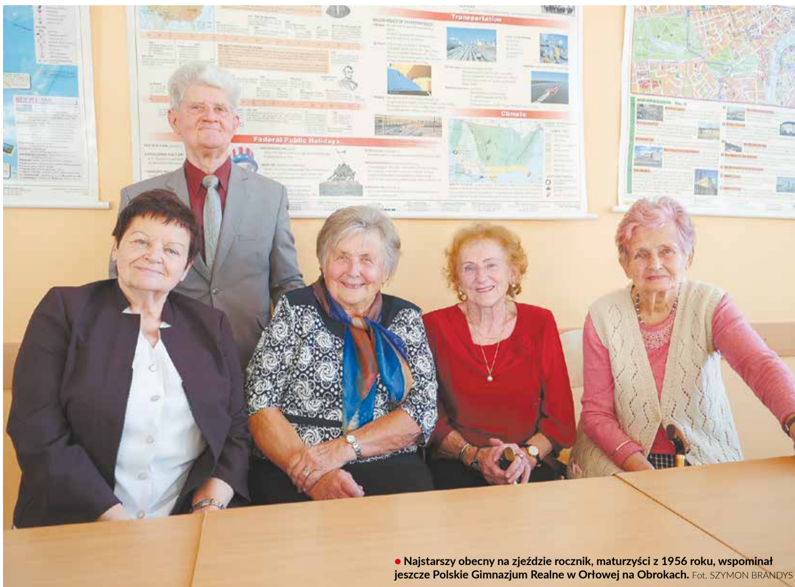
• Najstarszy obecny na zjeździe rocznik, maturzyści z 1956 roku, wspominał jeszcze Polskie Gimnazjum Realne w Orłowej na Obrokach.

września 1909 powstało Polskie Gimnazjum Realne im. Juliusza Słowackiego w Orłowej. Szkoła wybrała na swego patrona wieszca, którego setna rocznica urodzin przypadła właśnie w tym roku. Dawny patron powrócił w nazwie czeskokocieszyńskiej placówki w 2014 roku