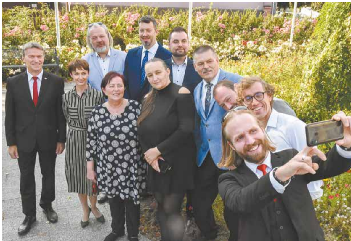
● Nowe władze PZKO w komplecie. Po tradycyjnym zdjęciu członkowie zarządu obowiązkowo zrobili sobie selfie. To znak czasów.

Zanim doszło do wyborów, Legowicz przedstawiła sprawozdanie z działalności Zarządu Głównego. Zwróciła w nim m.in. uwagę, że ten spotykał się regularnie, co najmniej 10 razy w roku, nawet w okresie pandemii, w formie online. Omawiając działalność biura