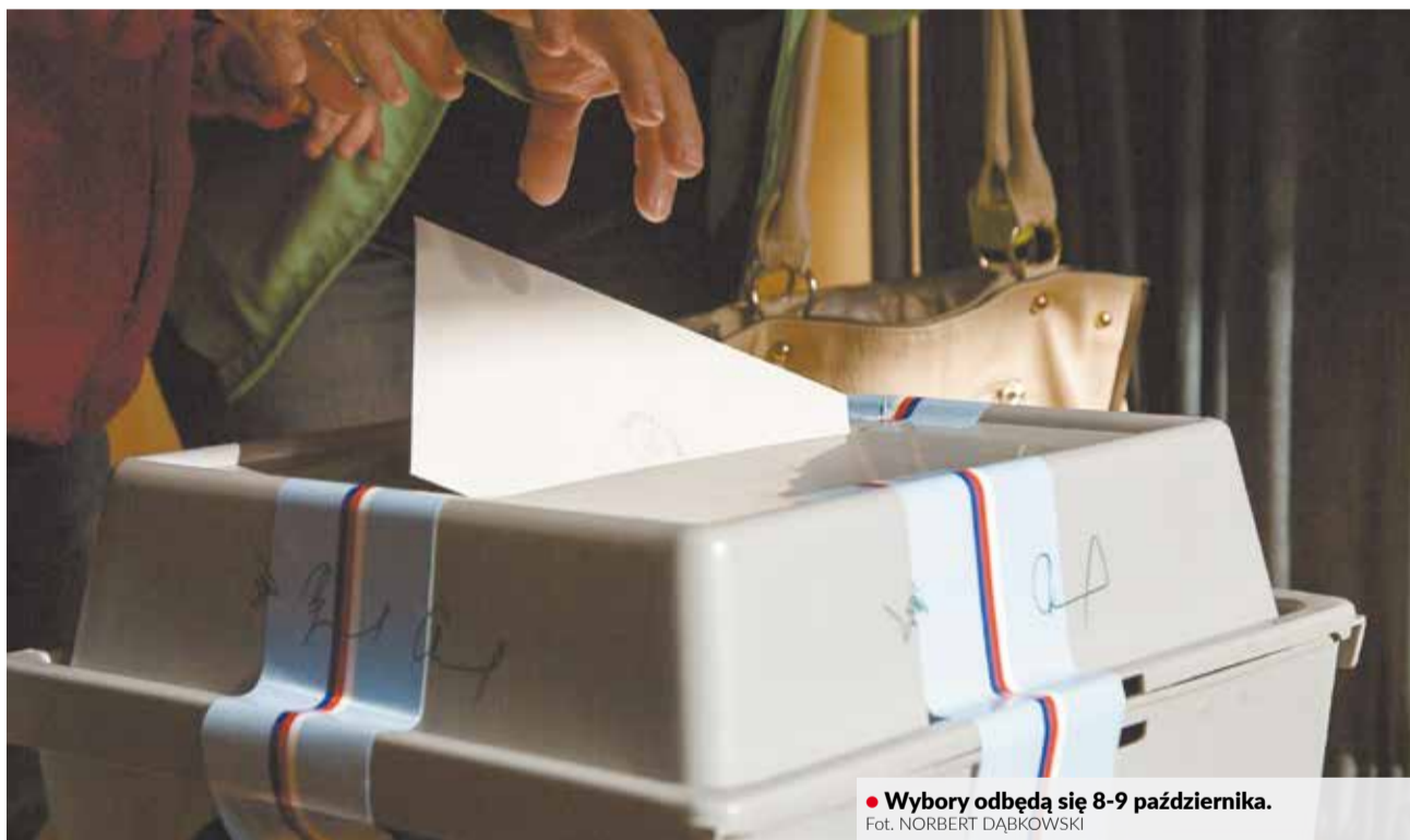
• Wybory odbędą się 8-9 października.

Według sondażu opublikowanego w niedzielę przez agencję Kantar, opracowanego na zlecenie Telewizji Czeskiej, do parlamentu powinny