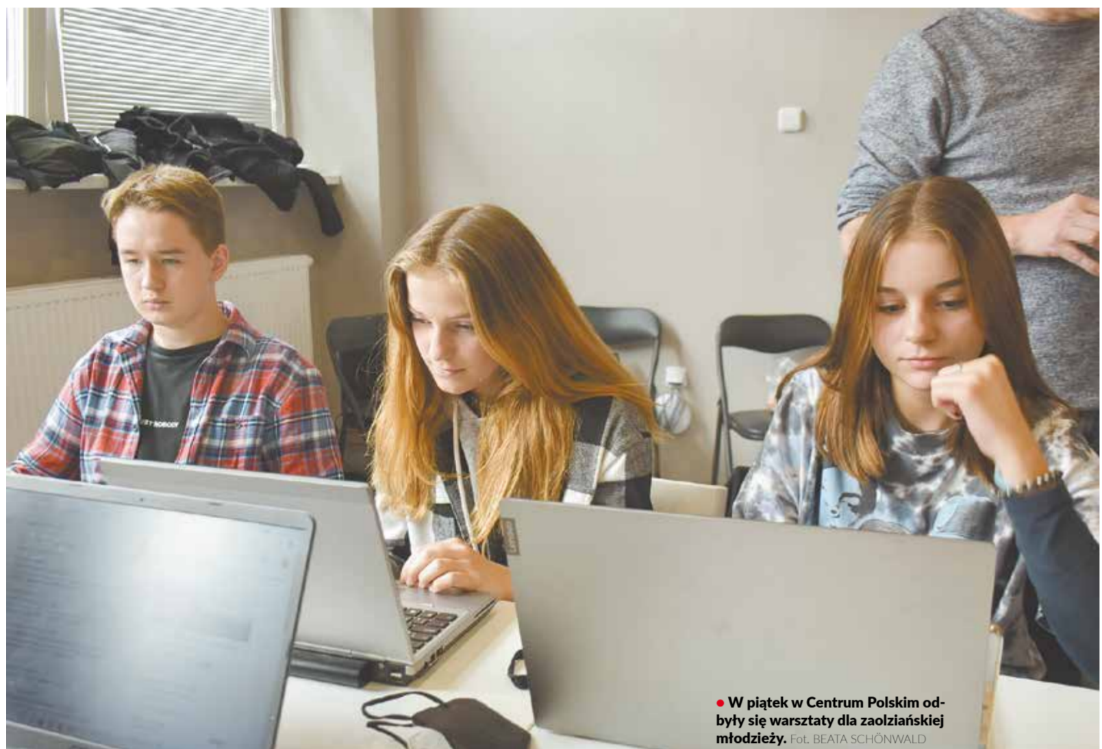
W piątek w Centrum Polskim odbyły się warsztaty dla zaolziańskiej młodzieży.

Znacznie więcej polskich i czeskich haseł w wolnej encyklopedii o Śląsku Cieszyńskim po obu stronach granicy oraz wykształcenie nowego pokolenia wikipedystów, to główne cele projektu edukacyjnego pn. „Śląsk Cieszyński w Wikipedii”. Jego realizacja ruszyła w ub. tygodniu.