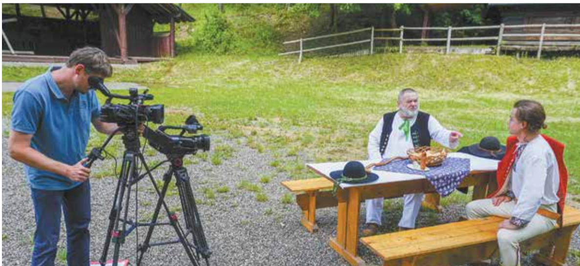
• Przed rokiem organizatorzy Gorolskiego Święta zamiast festiwalu przygotowali specjalny film, który zaprezentowali w Internecie. W tym roku planują natomiast transmisję on-line z występów w jabłonkowskim amfiteatrze.

WYDARZENIE: W najbliższą sobotę, punktualnie o godz. 17.00, w Domu PZKO w Jabłonkowie rozpocznie się 74. Gorolski Święto. W tym roku popularny „Gorol” potrwa tylko dwa dni i ze względu na obowiązujące obostrzenia epidemiczne jego program po raz drugi z rzędu będzie odbiegać od wieloletniej tradycji.