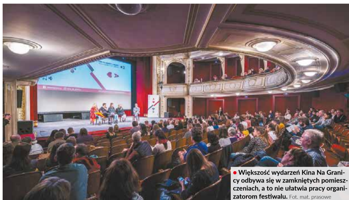
• Większość wydarzeń Kino Na Granicy odbywa się w zamkniętych pomieszczeniach, a to nie ułatwia pracy organizatorom festiwalu.

WYDARZENIE: Tego lata, po covidowej przerwie, wracają do nas wielkie wydarzenia kulturalne. W Jabłonkowie szykują się do Gorolskiego Świąta, w Karwinie pracują nad Dolańskim Grómem, a w Cieszynie i Czeskim Cieszynie zapraszają na Kino Na Granicy. Nadal jednak sen z powiek spędza organizatorom „tłąca się” epidemia koronawirusa.