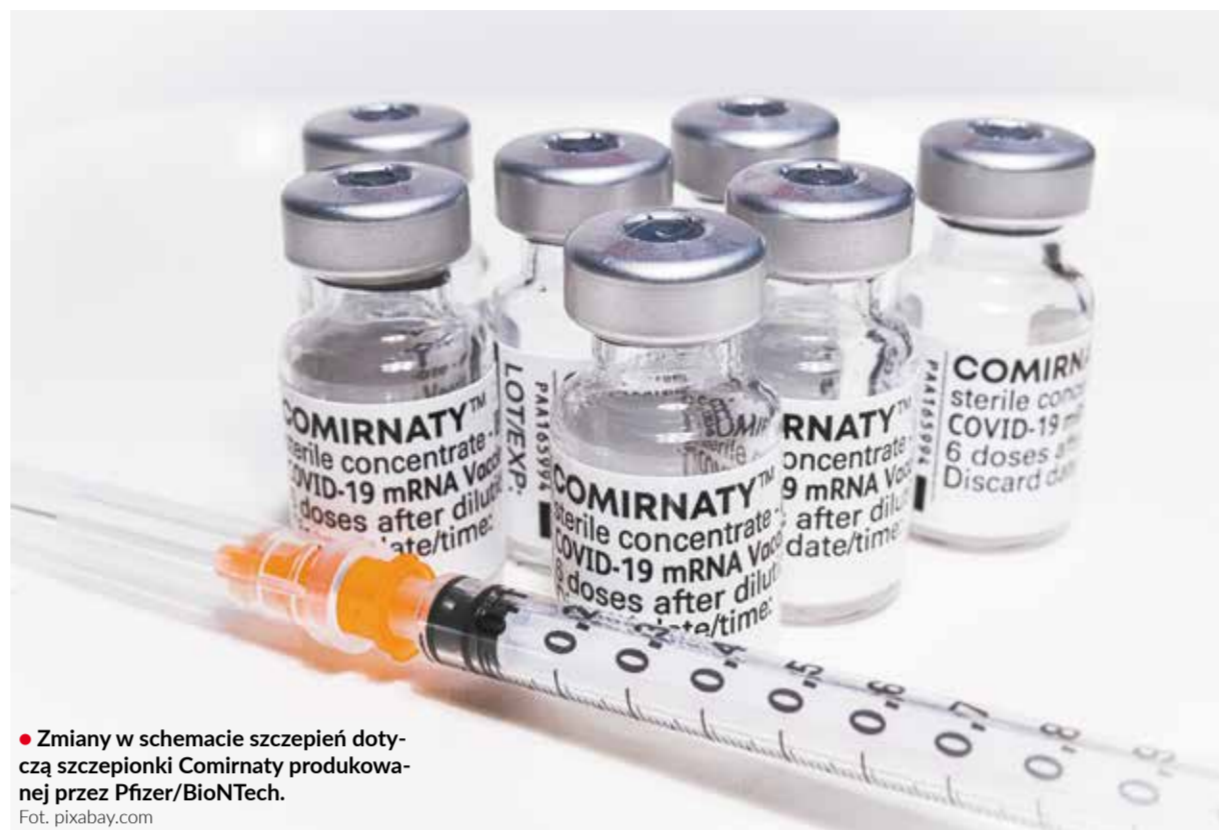
Zmiany w schemacie szczepień dotyczą szczepionki Comirnaty produkowanej przez Pfizer/BioNTech.

Osoby, które zarejestrowały się na szczepienie przeciw COVID-19, ale nie mają jeszcze przydzielonego terminu, będą miały skrócony odstęp między dwiema dawkami. Drugą dawkę otrzymają już po upływie 21 dni.