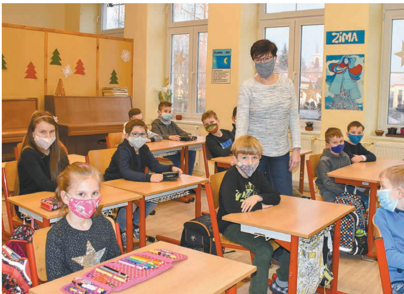
• W polskiej szkole w Olbrachcicach w tym półroczu nauka odbywała się głównie w szkolnych ławkach. Wystawienie ocen nie będzie tu stwarzać problemu.

stycznia to data zakończenia pierwszego półrocza roku szkolnego 2020/21. Jeżeli w tym terminie będzie trwało zdalne nauczanie, szkoła ma obowiązek zaznajomienia w tym dniu uczniów i ich opiekunów prawnych z treścią świadectwa półrocznego. Świadectwa muszą zostać rozdane najpóźniej w trzecim dniu powrotu uczniów do ławek.