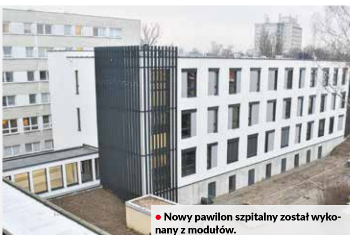
• Nowy pawilon szpitalny został wykonany z modułów.