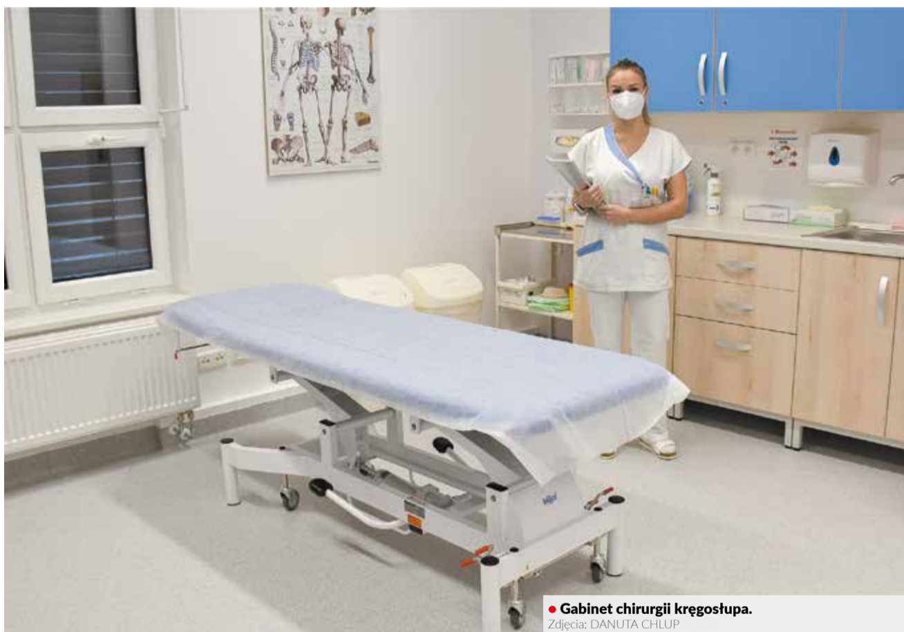
• Gabinet chirurgii kręgosłupa.