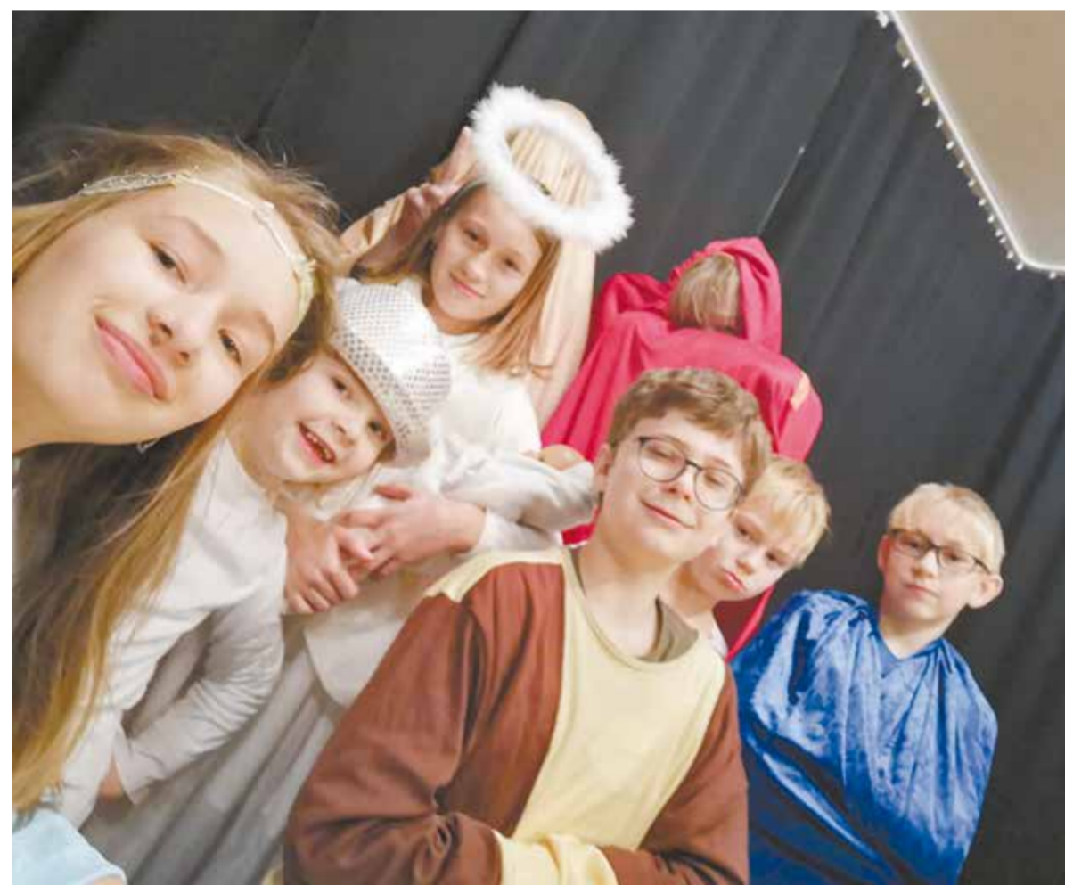
• „Jasełka z Agentem” można obejrzeć w Internecie.

W Trzyńcu-Nieborach tradycją są jasełka wystawiane przez teatryki dziecięce. Do Domu PZKO w okresie świątecznym tłumnie przybywają goście, aby obejrzeć co roku inną, ale zawsze pomysłową i wesołą wersję historii o narodzeniu Jezusa. W tym roku spektakl musiał odbyć się w Internecie.