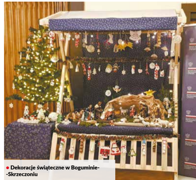
• Dekoracje świąteczne w Boguminie-Skrzeczoniou

Lutyni, Suchej Górnej i Karwiny oraz z przedszkola Diakonii Śląskiej w Boguminie. Do pracy też prace z polskich szkół z Hawierzowa-Błędowic, Orłowej-Lutyni, Suchej Górnej oraz diakonijnej szkoły z Bogumina. Zdjęcia prac zostały opublikowane na stronie facebookowej Miejskiego Koła PZKO, gdzie można było na nie oddać swój głos. ▲