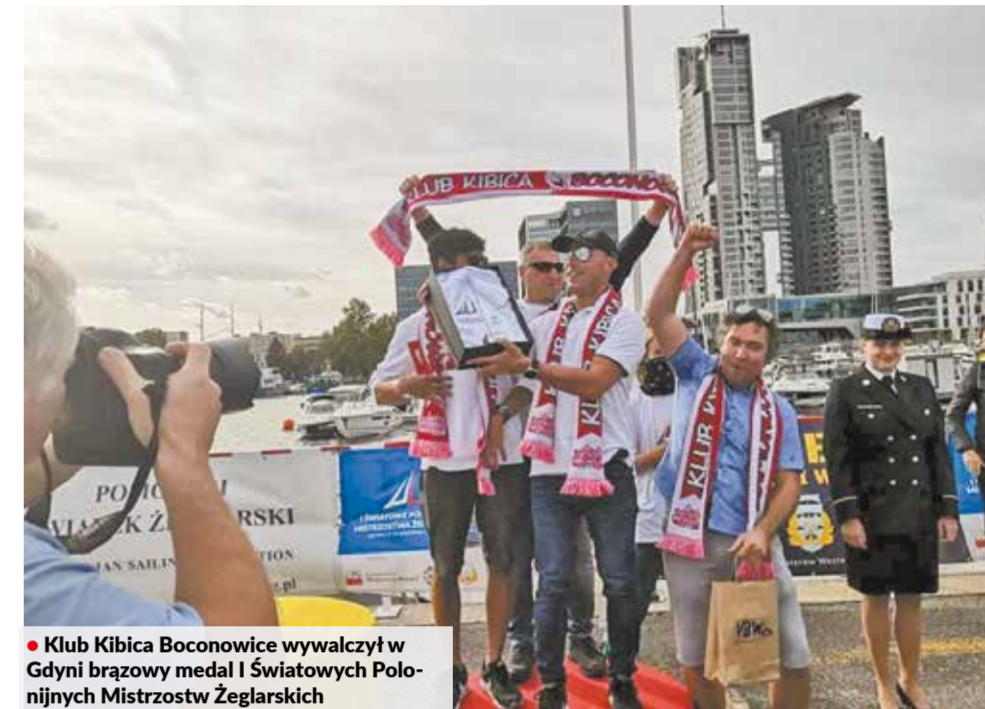
• Klub Kibica Boconowice wywalczył w Gdyni brązowy medal I Światowych Polonijnych Mistrzostw Żeglarskich

I choć był to ich debiut na tego typu zawodach, przywieźli do Boconowic brązowy medal z I Światowych Polonijnych Mistrzostw Żeglarskich w Gdyni. ▲