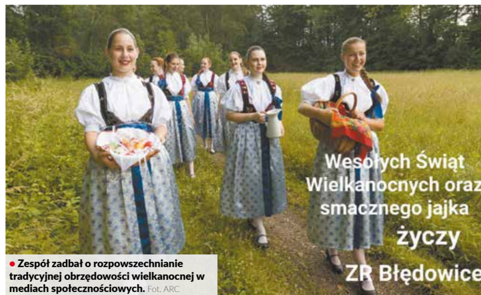
• Zespół zadbał o rozpowszechnianie tradycyjnej obrzędowości wielkanocnej w mediach społecznościowych.

Do uczestnictwa w takiej próbie wystarczył zatem Internet, przynajmniej trzy metry kwadratowe podłogi i dobry humor, którego nie zabrakło tak, jak na normalnych próbach. Zespół też zadbał o rozpowszechnianie tradycyjnej obrzędowości wielkanocnej w mediach społecznościowych. Było więc malowanie jajek na Facebooku, przypomnienie śmiernika oraz chodzenie z goiczkami. Dziewczyny, każda w swoim domu, nagrały piosenki, z którymi goiczkami chodziły po domach oraz wiersze. Filmiaki zespół połączył w jeden i opublikował na YouTube. Na kolejnym filmiku uwiecznione zaś było chodzenie po śmierguście,