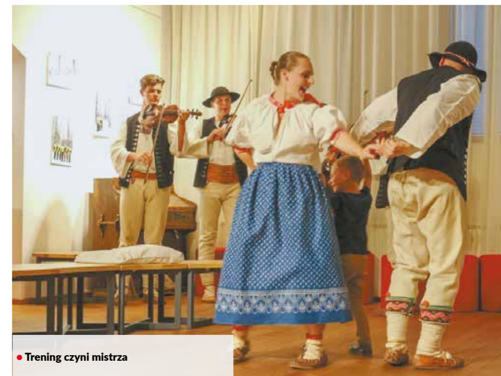
• Trening czyni mistrza

W maju w Muzeum i Centrum Informacyjnym w Bystrzycy (MUZ-IC) pojawiła się wystawa zdjęć pt. „Perły folkloru – śladami bystrzyckiej działalności folklorystycznej”. Autorem wszystkich zdjęć jest młody fotograf Michał Wybranęć z Czeskiego Cieszyńska. Fotografie można było oglądać w ubiegłym roku w trzynieckiej Trisli z okazji jubileuszowego koncertu zespołów „Bystrzyca” i „Łączka”. Fotografie zostały zrobione podczas czternastu sesji zdjęciowych. Można było na nich zobaczyć dawnych i obecnych tancerzy zespołów i członków kapeli, które przegrávají w trakcie występów obu zespołów. ▲