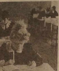
NA ZDJECIU: matura w Wileńskiej Szkole Średniej im. Wł. Syrokomli.

liczne na zróżnicowanie poziom i zainteresowania maturzystów.