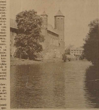
LIZDZBARK WARMINSKI. U góry — zamek gotycki; u dołu — Wysoka Brama i fragment murów średnio-wiekowych.