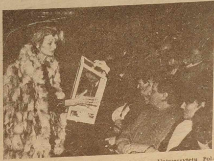
Zbiórka pieniędzy na konto planowanego Uniwersytetu Pol-skiego.