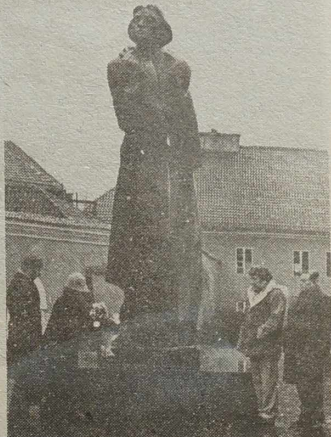
Delegaci na zjazd ZPL złożyli kwiaty przed pomnikiem Adama Mickiewicza.

ność i tolerancję, ale samo-rządy Wileńszczyzny są roz-wiązane, dokonano zmian w komisjach prywatyzacy-jnych, a na miejsce Polaków mianowani są ludzie często z nomenklatury.