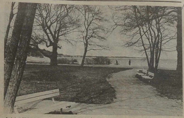
Jesień w Nidzie.

A więc wilmianie, którzy nie mają pracy — mogą zwracać się do Giełdy Pracy: Wilno, ul. Toruń 2/8, pokój 201, tel. 62-07-67.