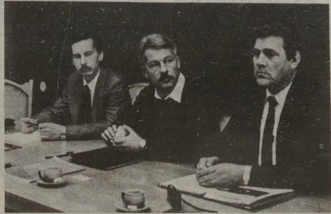
czą przedsiębiorstwa: z fińską firmą „Neste” oraz z amerykańską „Tokheim”.

Aktualnie „Lietuwas Kuras” ma już dwa wspólnie z zagrani-