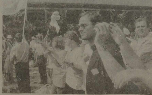
Alina LASSOTA NA ZDJĘCIACH: migawki jasnogórskie.

wia do rozśpiewanych sektorów: — Chcę zwrócić waszą uwagę na trzy słowa „Jestem”, „Pamiętam”, „Czuwam”. W krzyżu objawiło się Boskie Jestem Nowego Przymierza... Podajmy zatem sobie ręce. Zaspiewamy „Ojciec Nasz” po łacinie. Język ten jednoczył kiedyś Europę. ...Już przed świtem znów wypełniały się sennie jeszcze sektory. Z trudem znajdujemy miejsce stojące. Dziś, w Dniu Wniebowstąpienia Najświętszej Maryi Panny podczas Mszy świętej usłyszymy: „Rozwajście swoje talenty. Wzrastajcie jako osoby w Chrystusie. Jesteście Kościołem Nadziei”... „Abba Ojciec” — płynię po- ...żny śpiew u podnóża Sanktuarium Czarnej Madonny. Lu- dzie podają sobie ręce na znak pokoju, Umocnieni w duchu i