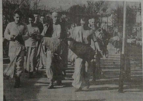
CZY DESZCZ, CZY POGODA...

...„Katarynkę” B. Prusa. „W cał- kowiła panikę wpadliśmy, gdy w czasie piśmennego egzaminu z algebry „podano nam przyk- ład z tematu, którego nie było w programie”. Ale wszystko dobre, co dobrze się kończy. Janek pomyślnie ukończył w tym roku również siedmioletnią Szkolę Muzyczną im. B. Dwa- rionasa, ma zamiar kontynu- wać naukę zarówno w szkole średniej, jak i muzycznej. And- rzej natomiast obrał zawód sto- larza, w przyszłości będzie ro- bił meble. — Ciężko było — mówi And- rzej — miałem trochę zapusz- czoną naukę, a ściągac nie chciałem, zresztą i ci, którzy mieli ściągę, z nich nie skorzy- tali. Ale teraz jestem dumny i zadowolony z siebie. Cóż, szerokiej i szczęśliwej drogi, kochani dziedziatoklasiści, Danuta KOZŁOWSKA NA ZDJĘCIU: uroczystość wzręcania świadectw w Wileń- skiej Szkole Średniej im. W. Sy- romkili.