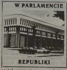
W PARLAMENCIE REPUBLIKI

Frakcja lewicowa była inicja- torką innego głosowania pod- czas uchwalania projektu uch- wwały, dotyczącej utworzenia komisji parlamentarnej do zbada- nia faktów naruszających porzą- dek publiczny w Sziauliai i Kownie. Jednak dokument nie