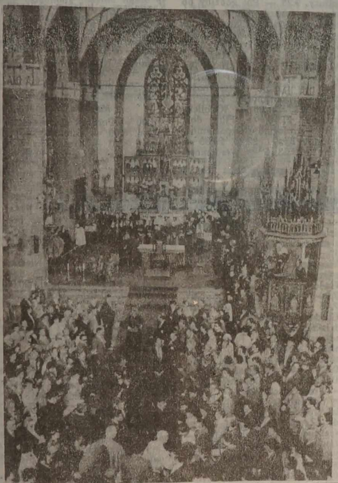
NA ZDJĘCIACH: fragmenty pielgrzymki Papieża w Olsztynie.

Olsztyńskie uroczystości pasyjne mają temat główny: prawda w życiu człowieka i narodu... „NIE MA PRAWDZIWIEJ WOLNOŚCI BEZ PRAWDY“