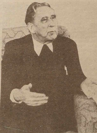
II. Chciałbym prosić, aby profesor podzielił się wspomnieniami o naszym wielkim Rodaku.

— W tym okresie kierownikiem katedry etyki był Karol Wojtyła — obecny papież Jan Paweł