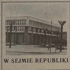
W SEJMIE REPUBLIKI

17 grudnia po przerwie Sejm kontynuował debaty w sprawie programu rządu Republiki Litewskiej. W debatach wzięło udział około 20 posłów na Sejm. Na zakończenie przemawiał premier Bronislovas Lubys. Omawianie tej kwestii transmitowało Radio Litewskie.