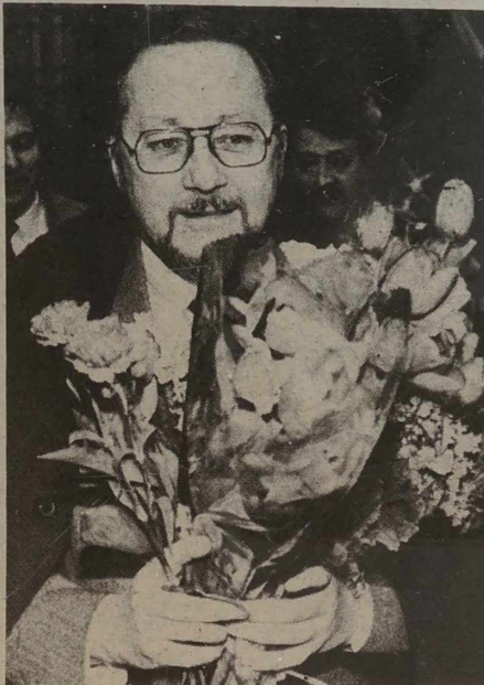
DO PRZEWODNICZĄCEGO RADY NAJWYŻSZEJ REPUBLIKI LITEWSKIEJ