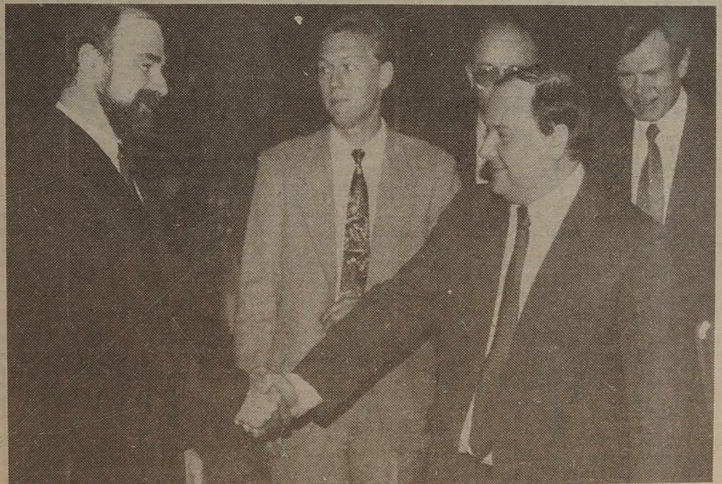
NA ZDJĘCIU: podczas spotkania.