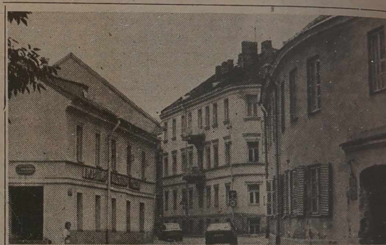
Migawki wileńskie. Ulica Mostowa.

Przewodniczący Rady Najwyższej Republiki Litewskiej Wytłumaczający WILANDSBERGIS Wilno, 9 lipca 1992 r.