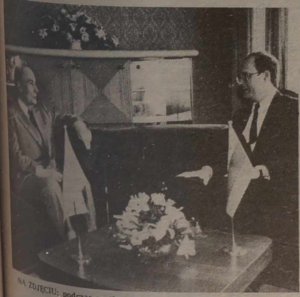
NA ZDJĘCIU: podczas spotkania.