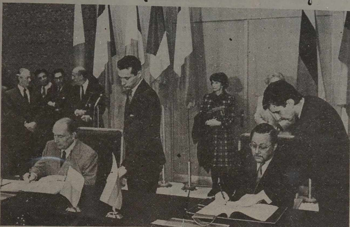
NA ZDJĘCIU: podpisanie umowy litewsko-francuskiej.