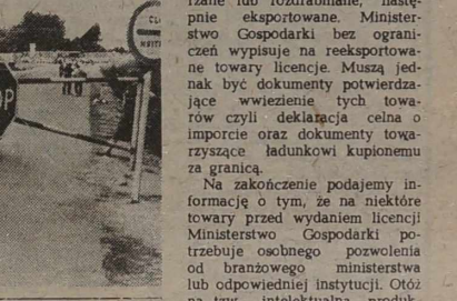
Przebieg kontrolny przy przekroczeniu granicy Litwy.

Dotychczas mówiliśmy wyłącznie o tym, co, w jakich ilościach można wwieźć zwyktemu człowiekowi, wybierającemu się za granicę. Ale te same przedmioty, których przewoźny turysta ma prawo wziąć tylko dwie sztuki lub w ogóle nie wnieść z powodu wysokiego cła, mogą być wywiezione absolutnie legalnie i w wielkich ilościach pod warunkiem, że jest się posiadaczem licencji. Jest to urządzenie, a raczej państwowe ze-