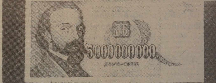
Nowy jugosławiański banknot o nominale 5 mld dinarów