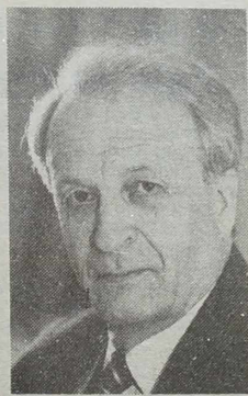
L. M. STANKEVIČIUS — MINISTREM OPIEKI SPOŁECZNEJ RL

Odpowiadając na pytanie dotyczące przyszłej debaty telewizyjnej z G. Vagnoriusem, premier oświadczył, że odbędzie się ona 3 listopada.