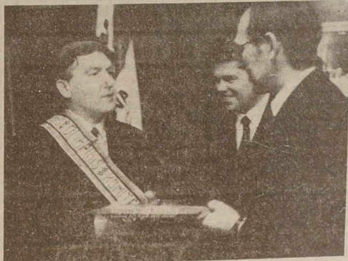
NA ZDJĘCIU: fragment powitania gościa w NKOl Litwy.

Tym razem również, choć prezydent PKOl przybył na Litwę wraz z matką, by poniekąd odzyskać tu swe korzenie (dziadko pana Szalewicza urodził się w latach 70 ubiegłego stulecia w położonych o kilka kilometrów od Kolesnik Holkudzichsach w rejonie sołecznickim), nie obeszło się bez oficjalnych (niezbity co prawda, to słowo tu pasuje) rozmów w NKOl Litwy o pers-