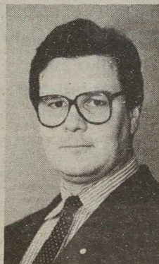
L. A. LINKEVIČIUS — MINISTREM OCHRONY KRAJU RL

Uwzględniając wniosek premiera Republiki Litewskiej Adolfa Slezevičiusa, prezydent powołał Laurinasa Mindaugasa Stankevičiusa na stanowisko ministra opieki społecznej Republiki Litewskiej.