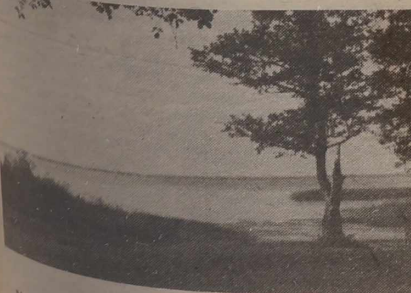
Nad jeziorom Wielka Szwakszta na Białorusi.