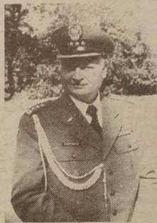
wówczas działo na terenie zamku w Miednikach.

Tej uroczystości towarzyszył piękny śpiew zespołu „Rudomianka”, który rozpoczął pieśnią „Boże coś Polskę”, a zakończył poniekąd drugim hymnem „Nie rzucim ziemi sądz nasz ród”. Właśnie tę pieśń w tym miejscu w lipcu 1944 r. zaśpiewali akowcy przed wywiezieniem do Kaługi.