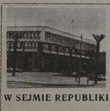
W SEJMIE REPUBLIKI