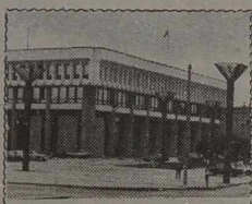
W SEJMIE REPUBLIKI

W trakcie sesji omawiano projekt ustawy o zmianach części statutu Sejmu, w którym regulacje się kwestionowania sesji, ich porządku.